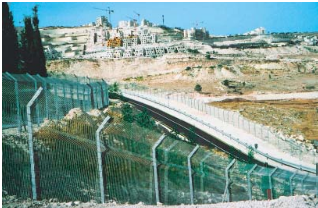
Eingezaunt und ausgegrenzt. Blick von Bethlehem über den Sperrzaun zur israelischen Siedlung Har Homa bei Jerusalem; geköpfte Olivenbäume; Kletterpartie über die Mauer in Abu Dis.

In rasantem Tempo wächst der israelische Bau einer Sperranlage, die im Westjordanland und im Raum Jerusalem möglichst viele jüdische Siedler von den Palästinensern in dem besetzten Gebiet trennen soll. Ein Augenschein vermittelt eine Ahnung von den Härten, die Israel im Namen der Sicherheit seiner Bürger den Betroffenen auferlegt.